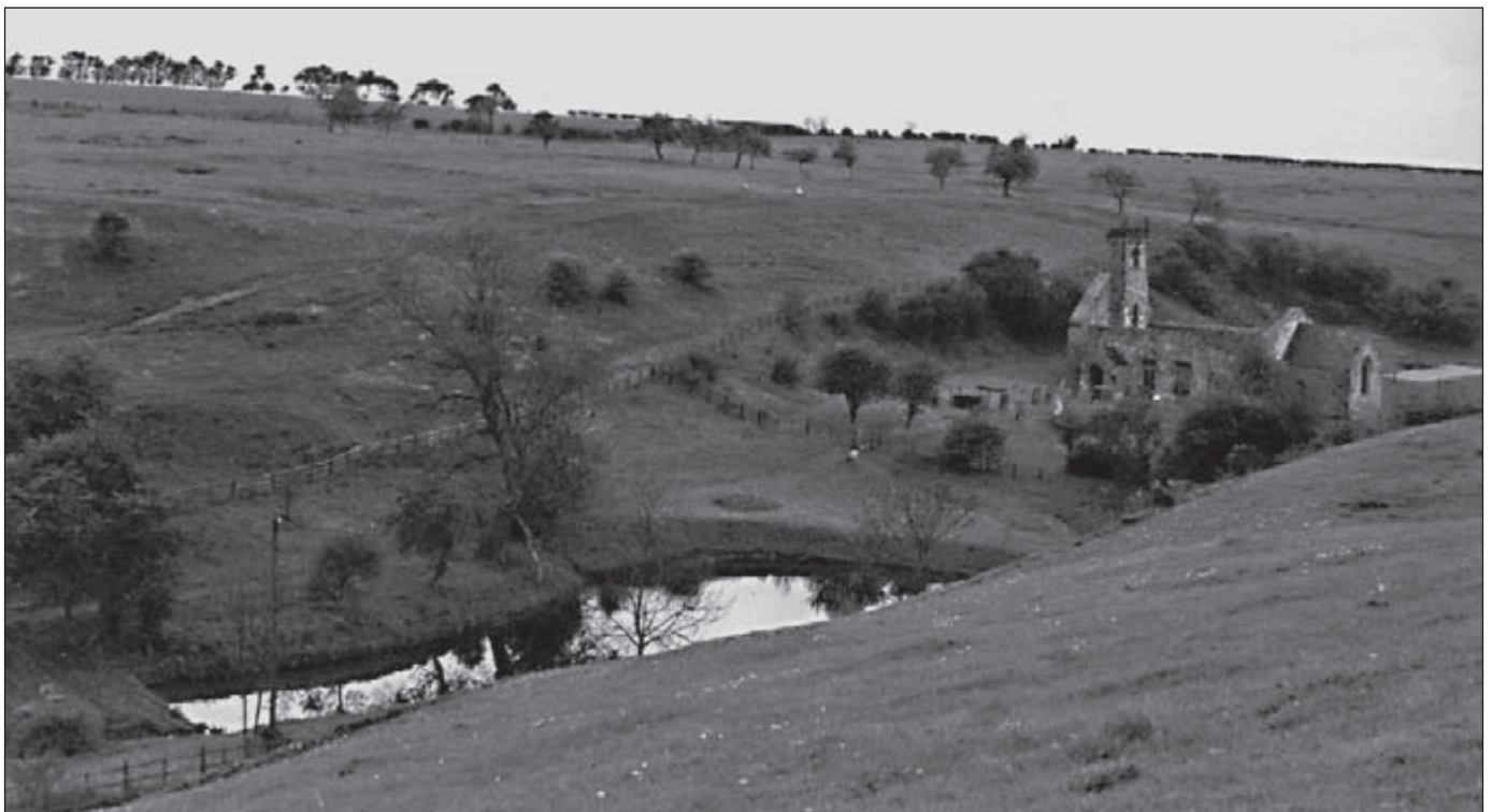
St Martin's Church in Wharram Percy

De hoofdroute volgt een afdaling naar de Whitestone Beck, een leuk onschuldig stroompje dat moet worden overgestoken. Maar verkijk je niet op zijn ogenschijnlijke onschuld want in het