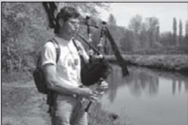
Wandelen met de doedelzak