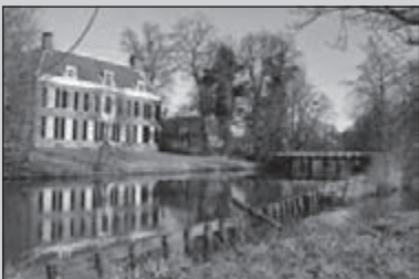
Utrechtpad in 6 etappes

De clubreis van april volgde een stukje GR5 en dit beekje deed hetzelfde!