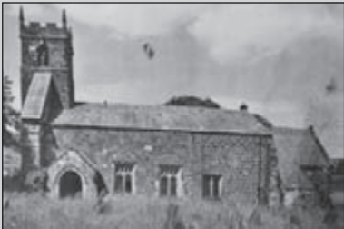
Verlaten dorp aan Wolds Way