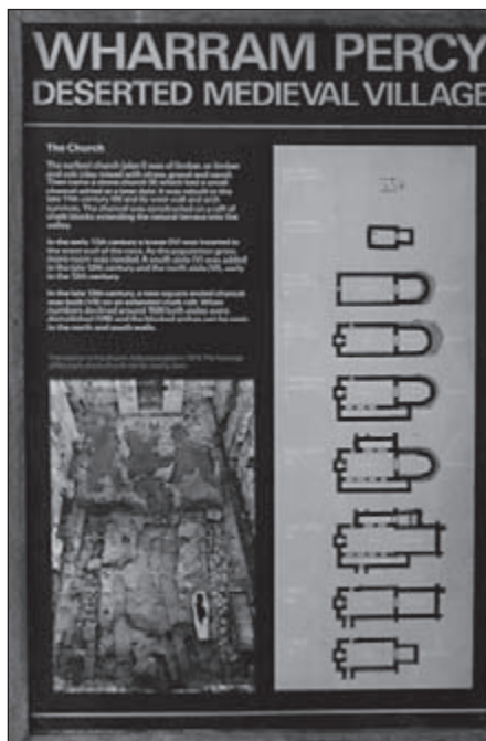
Op het infopaneel bij de ruïne is te zien hoe de kerk eerst steeds groter werd en toen weer kleiner

Liz kookt voortreffelijk en Ken serveert niet zo maar een pint of beer maar laat je eerst zijn local beers proeven en geeft daarbij een toelichting over smaak en